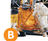
B وحدة أبولو القمرية قاعة بوينج لابتكارات الطيران معرض 100