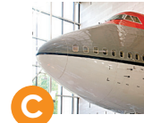
C مقدمة الطائرة بوينج ٧٤٧ أمريكا من الجو معرض 102