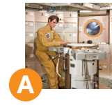
A محطة سكايلاب الفضائية سباق الفضاء معرض 114