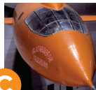
Самолет Белл Х-1 (Bell X-1) BOEING ЭТАПЫ РАЗВИТИЯ ПОЛЕТОВ Галерея 100