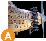
Самолет «Дух Сент-Луиса» ( Spirit of St. Louis ) BOEING ЭТАПЫ РАЗВИТИЯ ПОЛЕТОВ Галерея 100