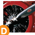
Самолет «Локхид Вега» Амели Эрхарт (Amelia Earhart's Lockheed Vega) BARRON HILTON ПИОНЕРЫ АВИАЦИИ Галерея 208